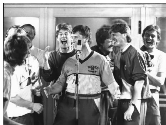
Sepp Piontek og VM-drengene under indspilningen af Re-Sepp-ten 1986.

Dansk fodbold fastholdt som et af de få europæiske lande amatøridealene helt frem til 1978 og først herefter kunne man gradvis begynde at stille med de bedste spillere på det danske landshold. Men der skulle ikke blot gøres op med amatøridealene, der skulle også gøres op med en "dansk mentalitet" så spillerne kunne begynde at yde det ypperste. Dette blev den tyske træner Sepp Pionteks opgave. Dansk fodbold i Mexico kan ses i lyset af det skifte, der skete med opgivelsen af amatøridealene og et mentalitetsskifte, der til en hvis grad spillede sammen med de nyliberalistiske tendenser, der politisk begyndte at dominere på samme tid.