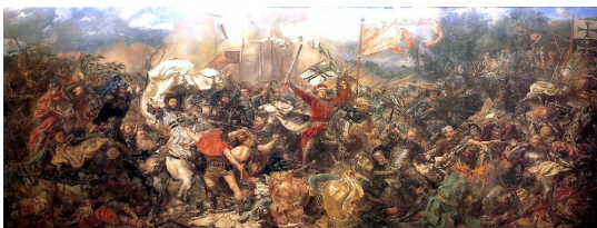
Slaget ved Tannenberg. Kunstner Jan Matejko fra http://wmda.mobi/da/Tyske_Orden

Allerede fra starten var kolonisation snævert forbundet med korstogsbevægelse. Det gjaldt korstogene til det Hellige Land og det gjaldt korstogene i Østersøområdet. Det ser vi allerede, da der i 1108 blev kaldt til det første korstog i Østersøområdet, som vi har kendskab til. For at lokke korsfarere til fik de at vide, at de i lighed med de frankere, der var draget til det Hellige Land, ville kunne vinde ”den bedste jord at bo på”.