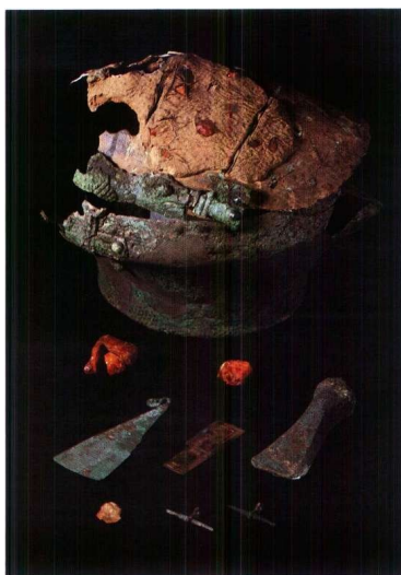
Fund fra Lusehøj

V. MUSEUMSINSPEKTØR, CAND. PHIL. MOGENS BO HENRIKSEN, ODENSE BYS MUSEER